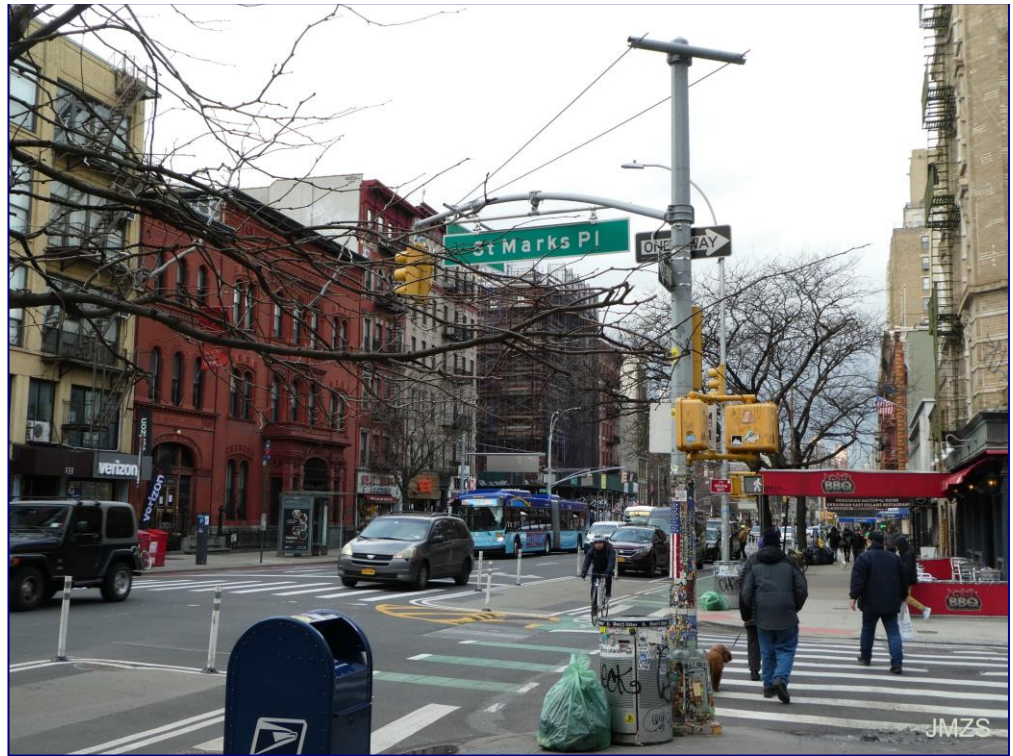
Bigarren abenida, East Village

Hotelera iritsita, argazkiak albumera igo ondoren, berriro ere joan naiz Manhattan zubira, hiriaz despeditzeko. Gero pizzeriara joan gara buelta batzuk eman ondoren, noodle batzuk afaldu genitzakeela bururatu zaigu, baina ez dugu aurkitu gustatu zaigun lekurik. Beraz, betiko lekura, pizza slice pare bat.