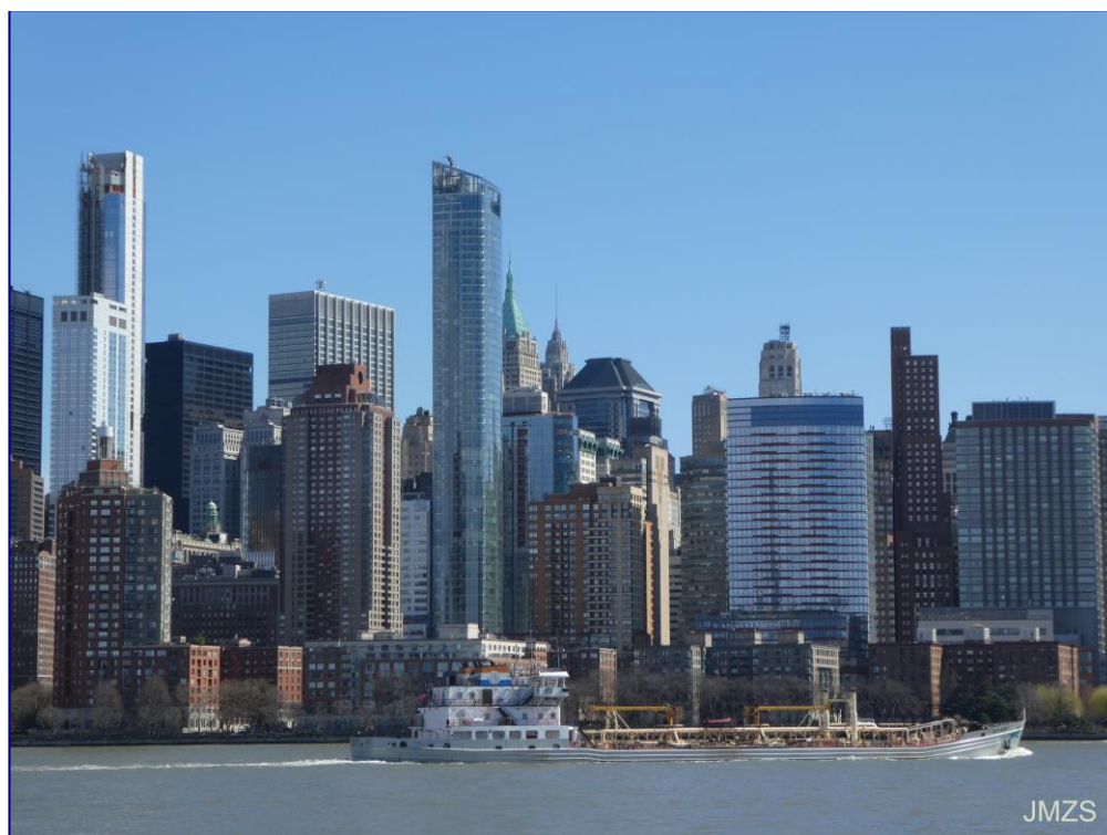
Downtown, Hudson ibaia

Hantxe bus bat hartu dugu 42. kalean zehar ekiteko mendebalde aldera, kairaino hurbiltzeko, eta busean ere jende gutxi, ia inor ez. Kaira iritsi garenean Circle Line ontzietako leihatilara, laster ateratzekoa zen barkurako txartela eskuratu dugu CityPassarekin, eskerrak hau behintzat erabili ahal izan dugula. Gustatu zait egin dugun buelta, Manhattan hegoraino eta handik Askatasunaren Estatuaren irlaraino. Egun polita zegoen, zerua urdina, argazki politak egiteko aukera izan dut. Gero ontzia Brooklyn, Manhattan eta Williamsburg zubien azpitik igaro da, Nazio Batuen eraikinera hurbildu arte. Han buelta eman eta hasierako kairaino itzuli gara. Hotza zegoen kubiartan batzuetan, nahiz eta eguzkiarekin beste batzuetan oso epel egon, disfrutatu dut ontziaren kanpoaldean, eta azkeneko zatia beheko kubiarta estalian egin dugu, leiho handi batetik begira.