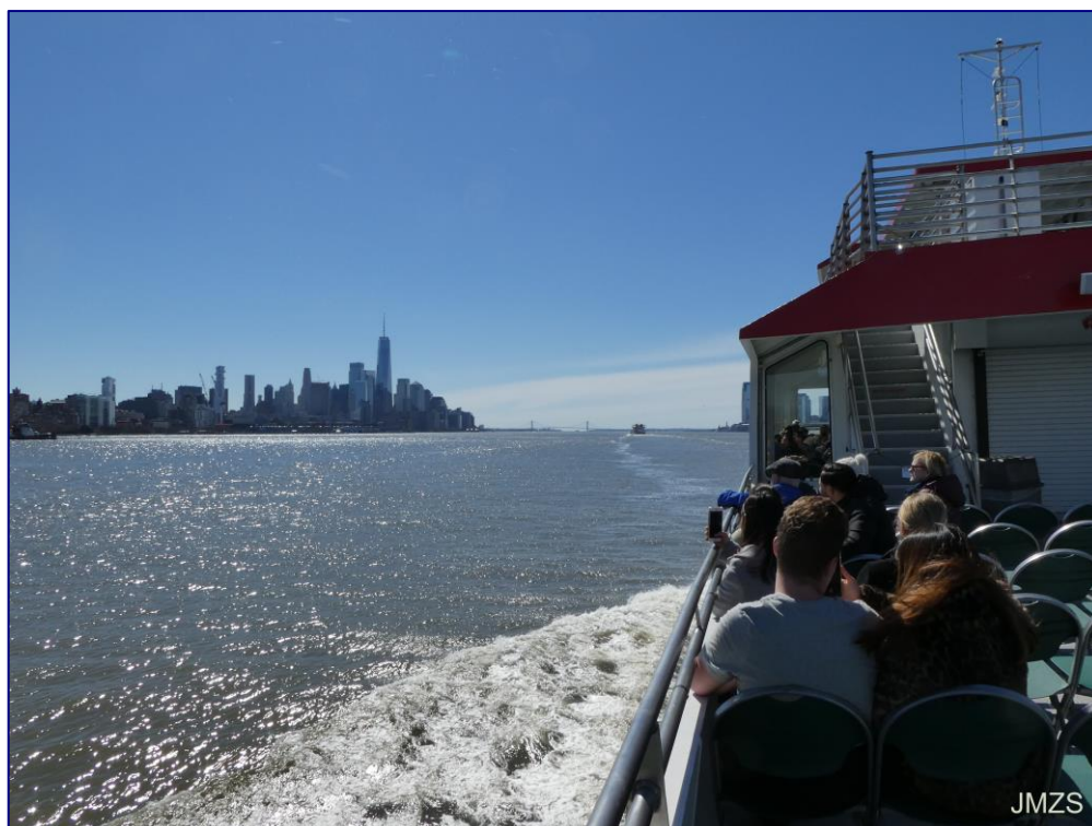
Lower Manhattan, Hudson ibaitik