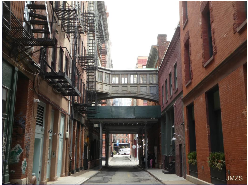
Staple Street, Tribeca