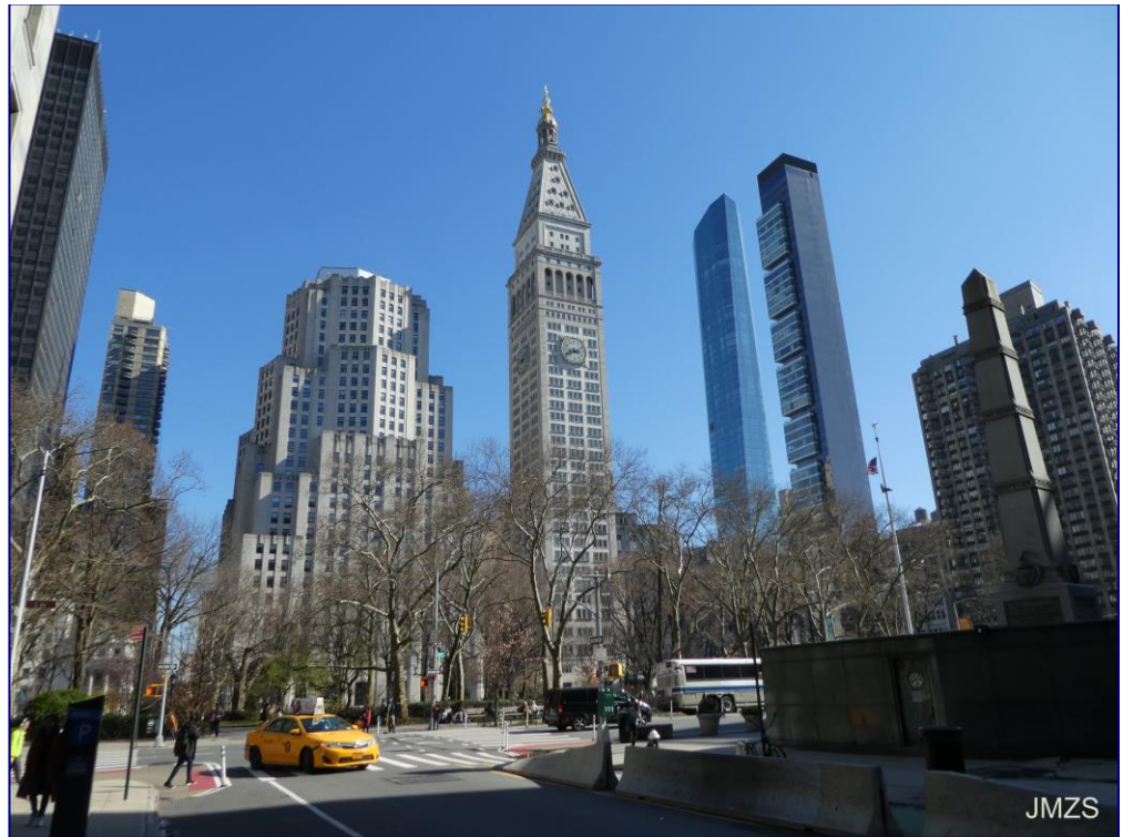
Madison Square Park

Madison Squaretik Union Squarera joan gara ibilian Broadwaytik, eta azken plaza honetan metroa hartu dugu hotelera etortzeko. Paseo luzea izan da eta nekatuta ginen. Eta ni pixalarriarekin, hori ere arazo bat da hiri honetan, komunak topatzea ez baita erraza.