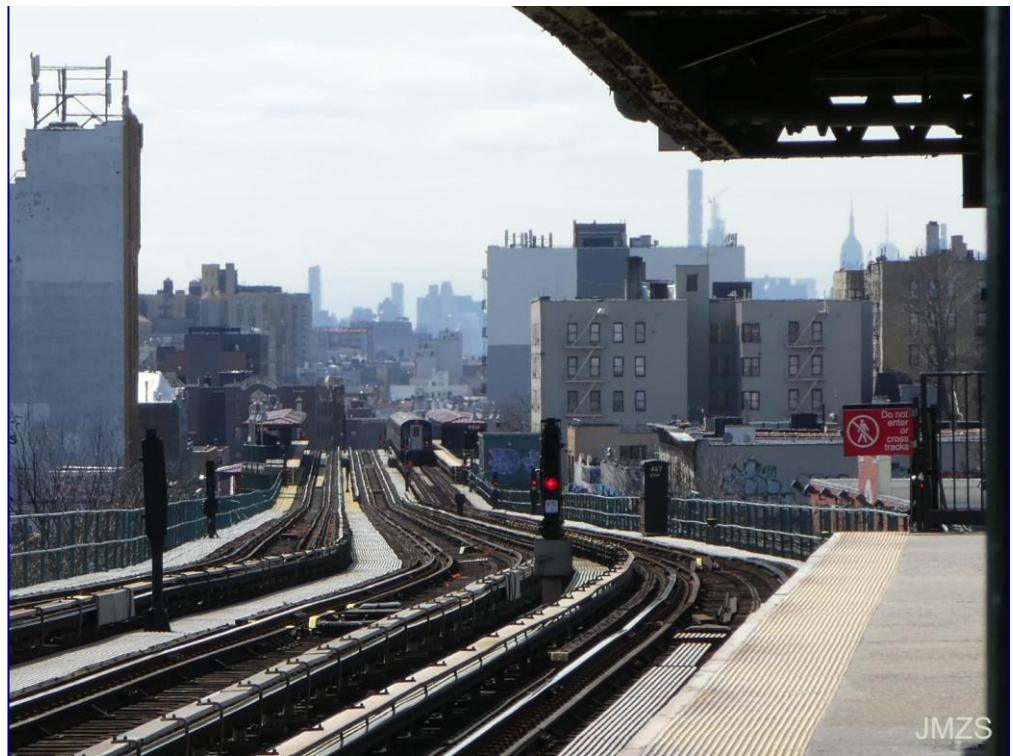
4. metro-linea, The Bronx

Iritsi gara azkenean etxera. Oso nekatua nago. Estres handia izan da, alde batetik, eta gero aireportua, hegazkina, metroa, geltokia, trena... Madril fantasmagoriko hori, kaletak eta geltokiak hutsik, eta horri guztiari ordu aldaketaren ondorioz bost ordu janda eta lo gutxi eginda, gorputzak ohea eskatzen dit. Burutik hau kendu, eta bidaian gozatu duguna noizbait paperera ekartzeko gogoz.