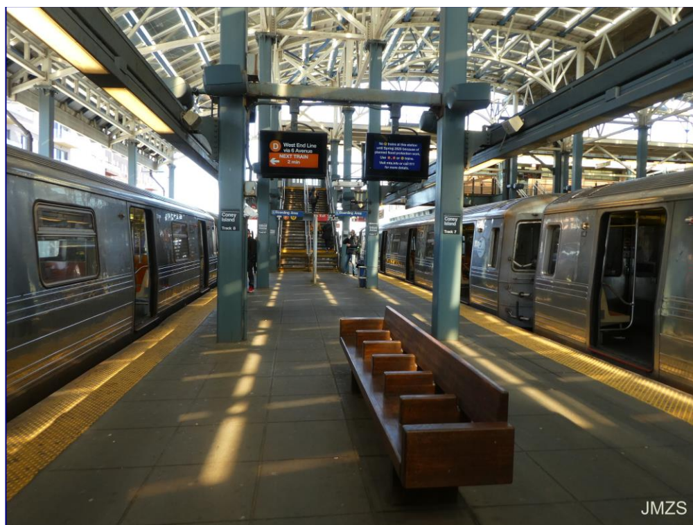
Coney Island, metro geltokia

Metroan oso jende gutxi zihoala iruditu zait gaur ere, ez dakit igande arrunt batean nola joango den linea hori, baina kontuan hartuta eguraldi ederra egiten zuela eta Coney Island igande goiz pasarako leku aproposa dela, nik esango nuke gaur oso jende gutxi zihoala metroan, gu eta beste gutxi batzuk, eta ibilbidearen azken tartean, gu eta beste mutiko bat besterik ez.