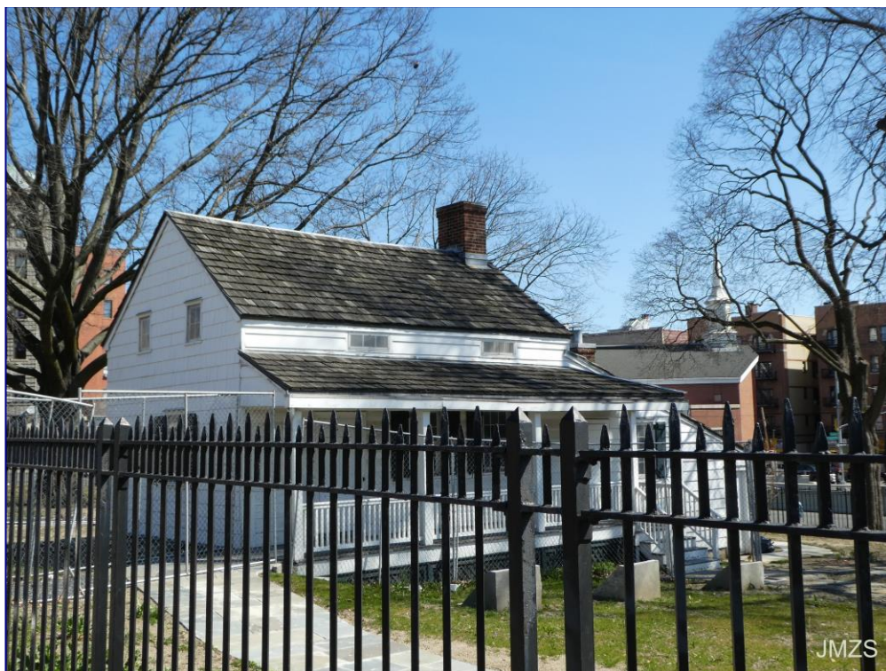
The Bronx, Edgar Allan Poe-ren etxea