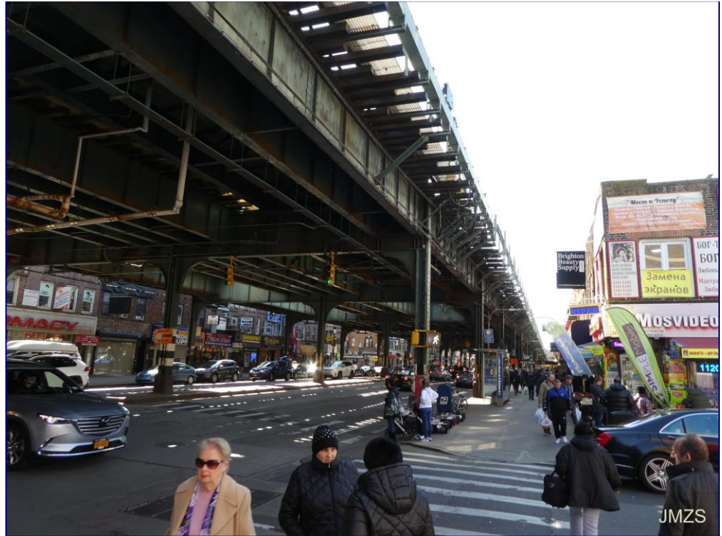
Brighton, Coney Island