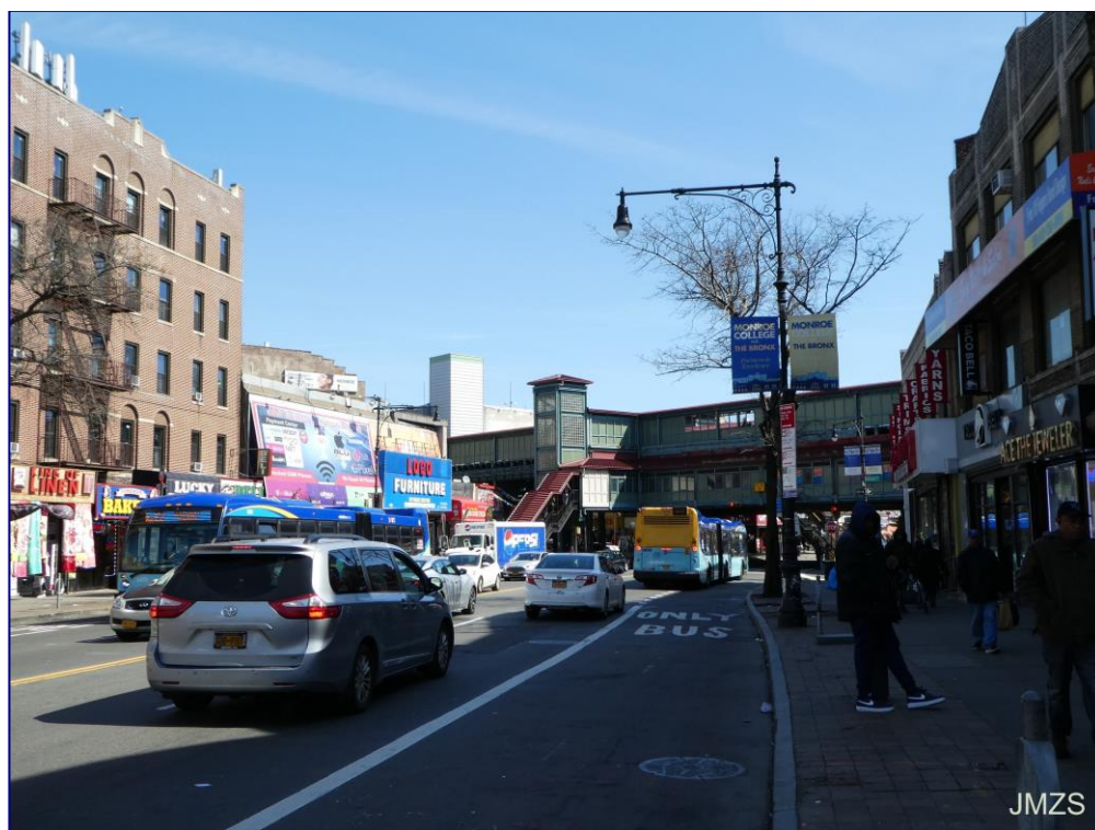
Fordham Heights, The Bronx

Edozein modutan, hegaldiarena ustez konponduta, gosaltzera atera gara gero Empire State eta Bronxera joateko asmoarekin. Baina, hara non, gosaltzen ari ginela, interneten begiratu eta Empire Staten orrian bazetorren atzo jartzen ez zuena, gaurtik aurrera itxita egongo dela. Ez nau harritu, egia esateko espero nuen, baina gogoratu naiz herenegun dorrearen azpitik pasatu ginenean aukera eduki genuela bertara igotzeko, eta hurrengo baterako utzi genuela axolagabe.